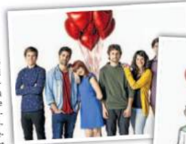
Cartel de la obra a imagen y semejanza del cómic.

«Nació para dos semanas en una sala alternativa del off más off de Madrid... Y ya lleva dos años y medio en cartel y ahora de gira», relata Rebollo. Mañana llega al Teatro Cam-