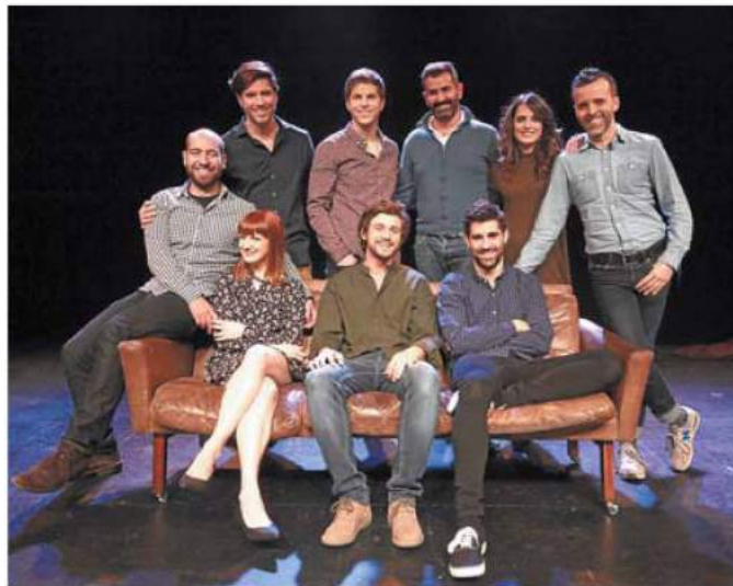
Actores y creadores de 'Amores minúsculos', la comedia que desde hoy se ofrece en Donostia. :: DV